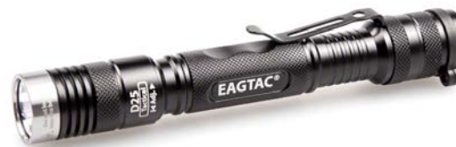
D25A2 Tactical Инструкция по эксплуатации

EagleTac D25A2 Tactical – компактный ручной фонарь, предназначенный для повседневного бытового использования и рассчитанный на повышенные нагрузки.